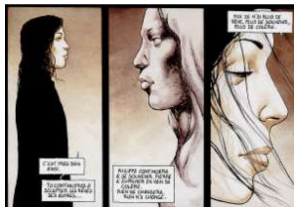
Vignettes extraites de l'album

« Arrachant les masques de ses semblables, portant les siens au gré de sa fantaisie, Lorenzo de Médicis promène sa silhouette d'ange déchu au milieu d'un carnaval de dupes. Cette décadence d'aristocrate, cette promenade dans la souillure et la corruption dissimulent le rêve d'une vie. Tendue vers un geste unique et insensé, Lorenzaccio travaille, solitaire, à son chef-d'œuvre. »