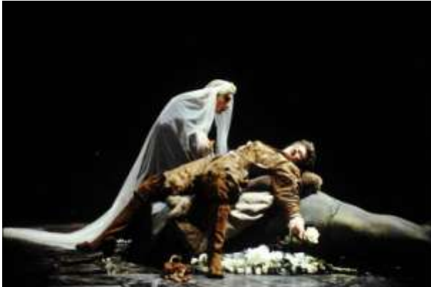
Mise en scène de Georges Lavaudant

Un exemple parmi d'autres : dans la mise en scène de Georges Lavaudant en 1989 comme dans celle de Jean-Pierre Vincent en 2000, Lorenzo s'habille en jeune mariée le soir du meurtre mais il s'agit là d'une raison tant dramaturgique que symbolique.